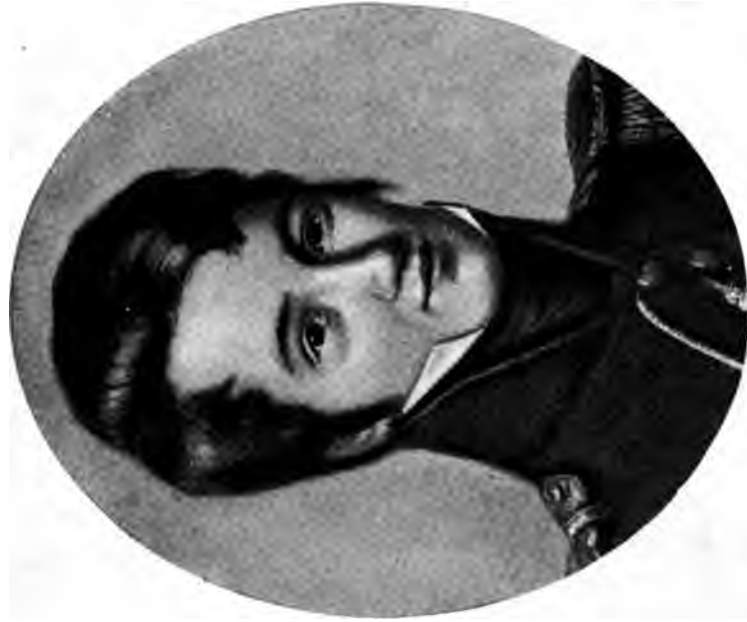
PORTRAIT D'ALFRED DE VIGNY d'après la peinture du Musée Carnavalet